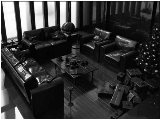
Christmas, sculpturale installatie, 2006.

Hans Op de Beeck werd bekend met een maquette: een nachtelijk kruispunt met stoplichten. Het werk is exemplarisch voor steeds terugkerende thema's in zijn werk: de vervreemding die besloten ligt in het moderne leven en de vervlakking, eenvormigheid en miscommunicatie die daarmee gepaard gaat. Hij creëert in zijn werken de sfeer van desolaatheid en leegte. Een echtpaar drinkt in een café een kop koffie zonder ook maar een woord met elkaar te wisselen of elkaar zelfs maar aan te kijken. Een lange rij verveelde caissières in een uitgestorven supermarkt zit duimen te draaien, een klant is in geen velden of wegen te bekennen. Dit is de moderne wereld zoals die door Op de Beeck wordt gepresenteerd, een niemandsland. Zijn ruimtelijke werken, video's en foto's van veelal dagelijkse scènes hebben gemeen dat ze de dingen op een zodanige manier uit hun context halen dat hun reden van bestaan op slag discutabel wordt.