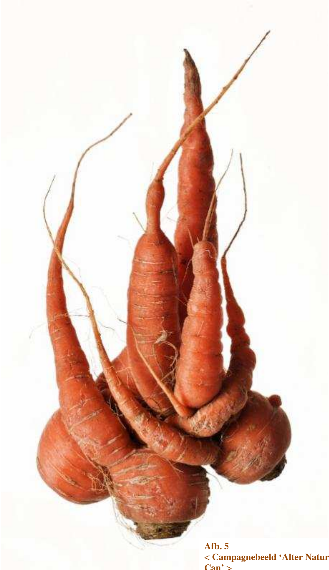
Afb. 5 < Campagnebeeld 'Alter Nature: We Can' >