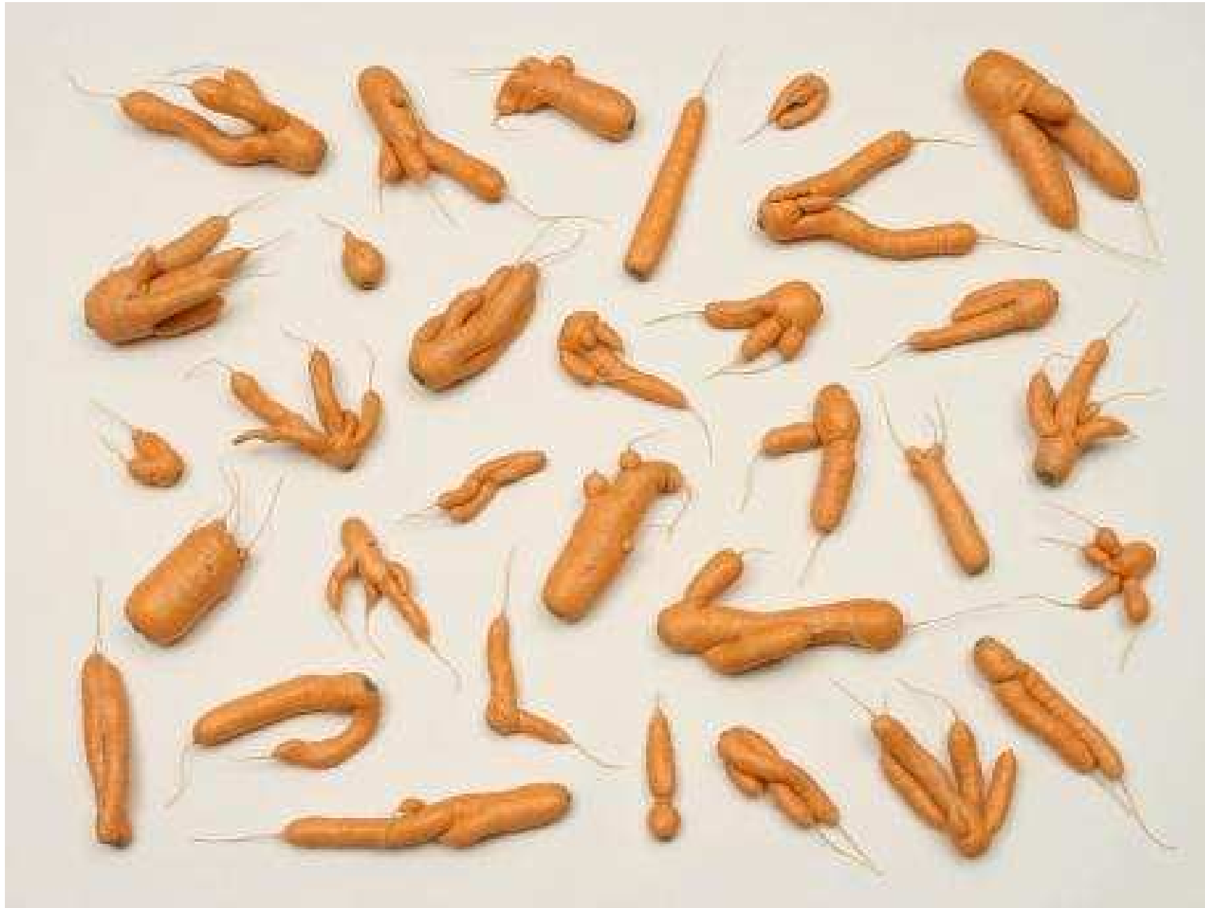
Afb. 4 < Driessens & Verstappen, Morphotheque #9 >