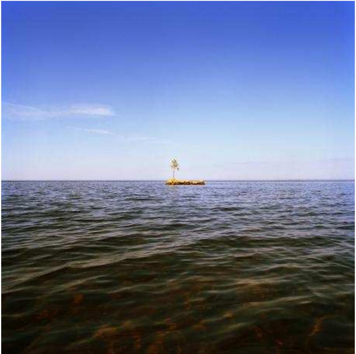
Afb. 2 < Antti Laitinen, it's my island >