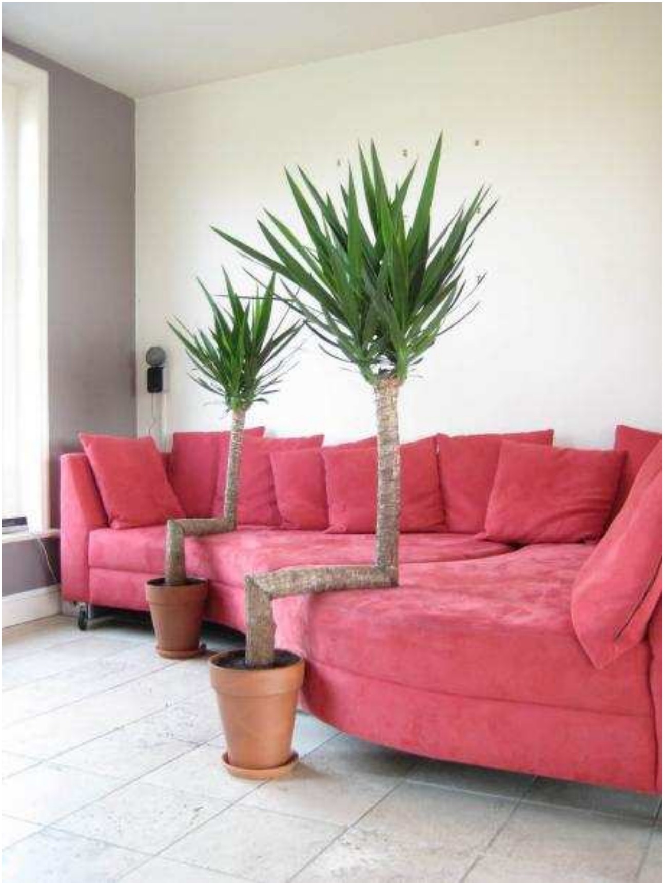
Afb. 6 < Reinier Lagendijk, zonder titel >