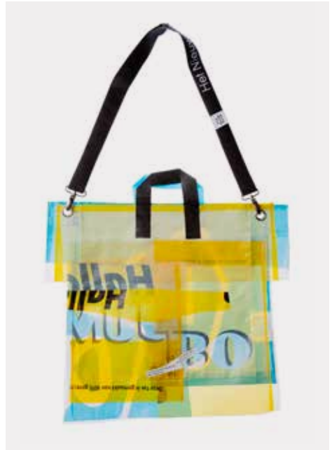
EVJ bag #113, commissioned by Z33 House for Contemporary Art, Design and Architecture, Jan van Eyck Academie and Het Nieuwe Instituut

Wie aan de balie van Z33 het formulier invult op evjbags.com (klik op 'available') kan zelf gratis caretaker worden van een tas. Vraag het aan een van onze medewerkers, en neem je tas vandaag nog mee.