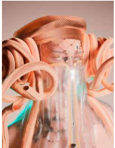
The Fabricant & Teresa Manzo - Medusa

The Fabricant is een pionier onder de digitale modehuizen. Ze verkochten het eerste digitale kledingstuk op de Blockchain. Een influencer had het aan op Instagram waar miljoenen het zagen, ook al droeg ze het niet in het echt. Als we allemaal zoveel tijd online doorbrengen, zijn de outfits die onze avatars dragen dan niet even echt? Hoe drukken we ons online uit en hoe willen we dat anderen ons zien? Dit zijn vragen die de metaverse en NFT's vandaag stellen, maar die The Fabricant al jaren stelt. Hun creaties bestaan 100% digitaal en overstijgen de fysieke grenzen van ons eigen lichaam.