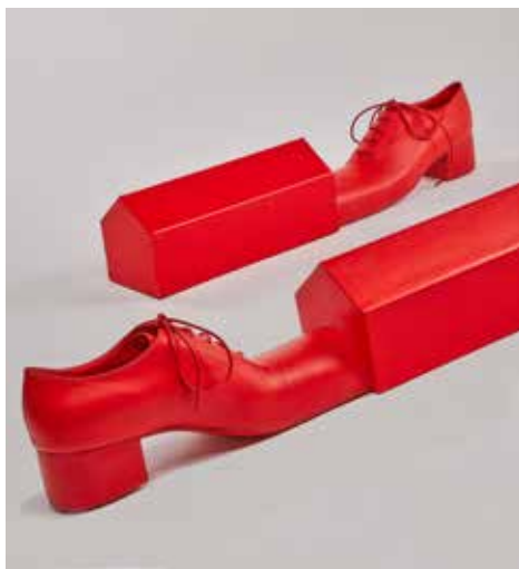
Jo Cope x Shelter

Tom Van der Borght, fragment uit Manifesto