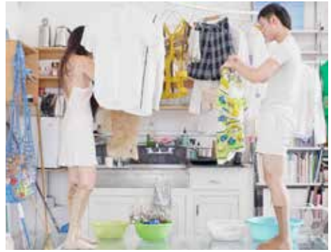
CFGNY x Junbi

De ontwerpers van CFGNY ( Concept Foreign Garments New York ) werken op het snijvlak van mode en identiteit. Hun drietalige video vestigt de aandacht op de tussenruimte van vertaling. Het wassen van kleding wordt gebruikt om een verhaal te vertellen over familiegeschiedenis en de invloed daarvan op het dagelijkse leven.